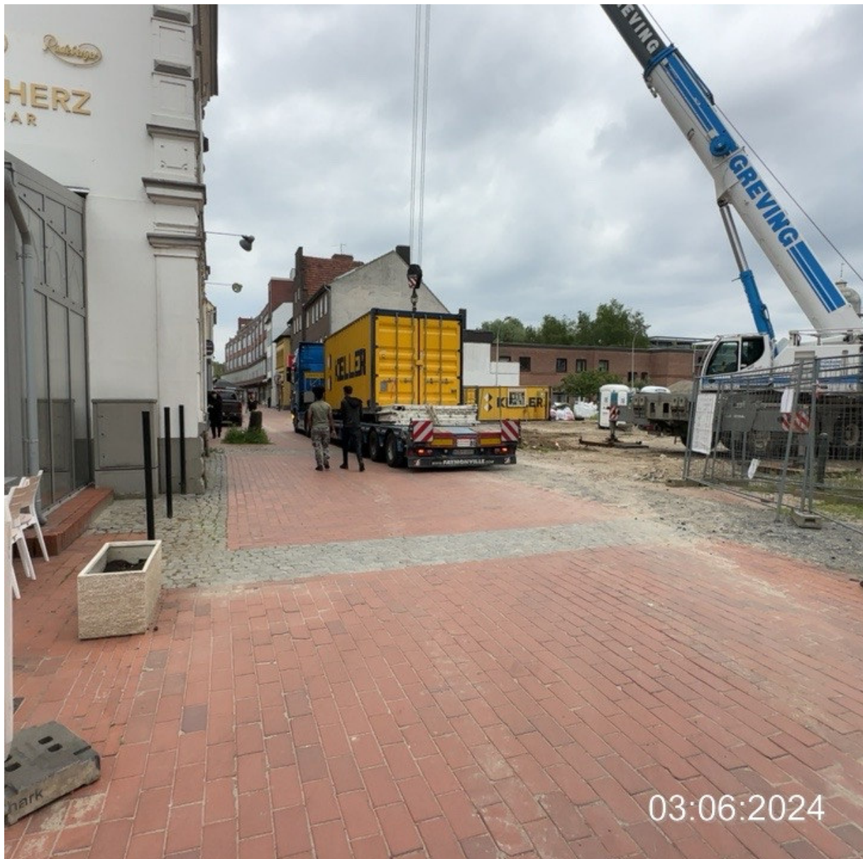
Bahnhofstraße, Baustelle, Anlieferung mit Sattelzug rückwärts