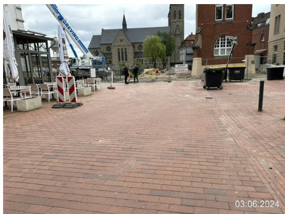
Mühlenhofstraße, Blickrichtung Bahnhofstraße