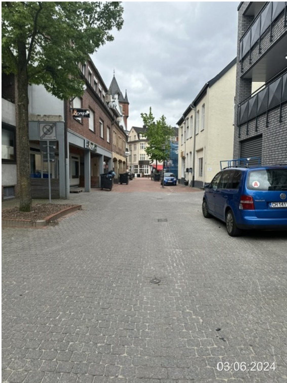
Mühlenmathe Blickrichtung Bahnhofstraße, enge Straßensituation