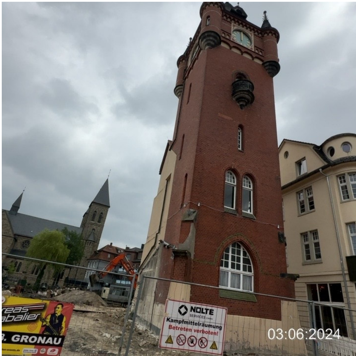
Bahnhofstraße, Baustelle, Blickrichtung historischer Rathausurm