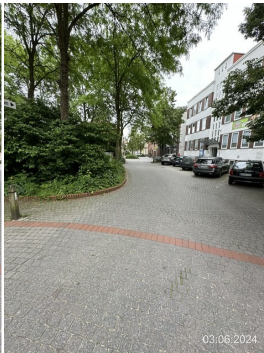
Mühlenmathe Blickrichtung Zollstraße, Kreisverkehr