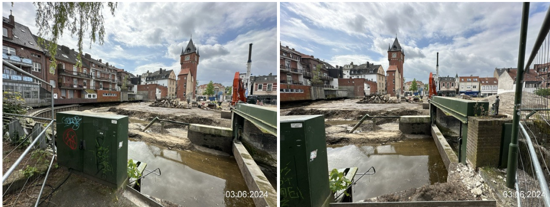
Baustelle aus Blickrichtung Rathausurm, im Vordergrund Dinkel mit niedriger Wasserführung