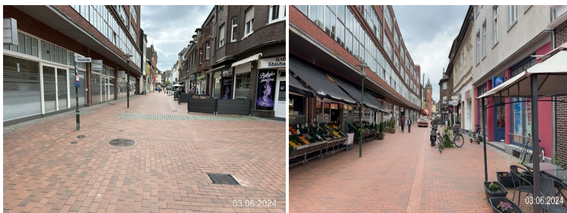
Bahnhofstraße, Blickrichtung historischer Rathausurm