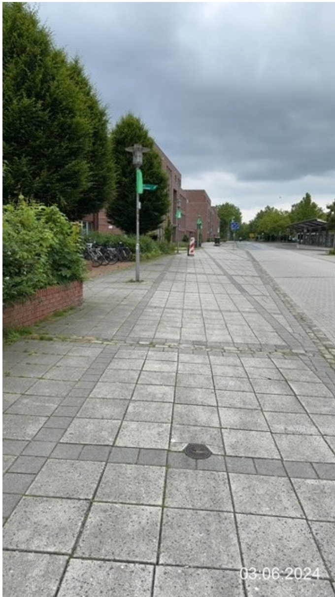
Bahnhofplatz, evtl. Wartezone LKW