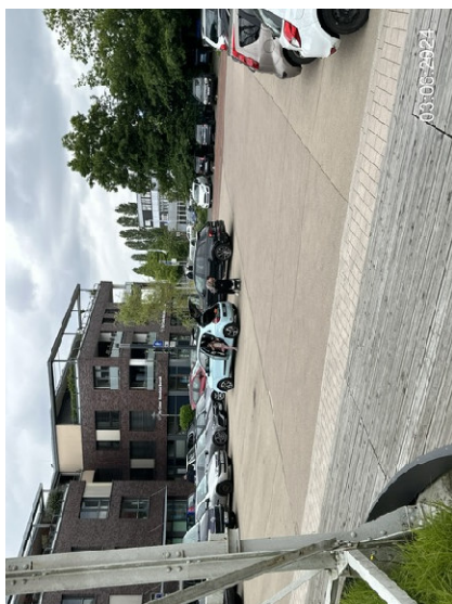
Parkplatz Kircheninsel, evtl. Aufstellort Containeranlage Ausbau