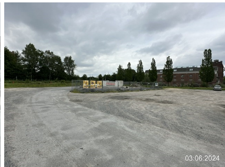
Parkplatz Zollstraße mit bereits abgesperrter Außenlagerfläche