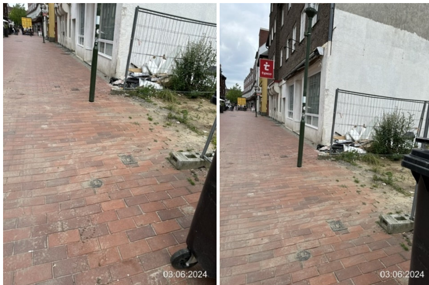
Bahnhofstraße, Blickrichtung Zollstraße