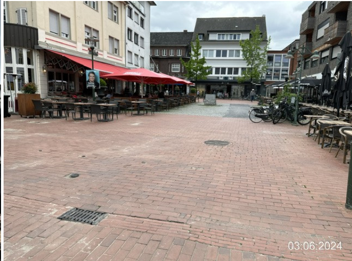
Theodor-Heuss-Platz mit historischen Rathausurm