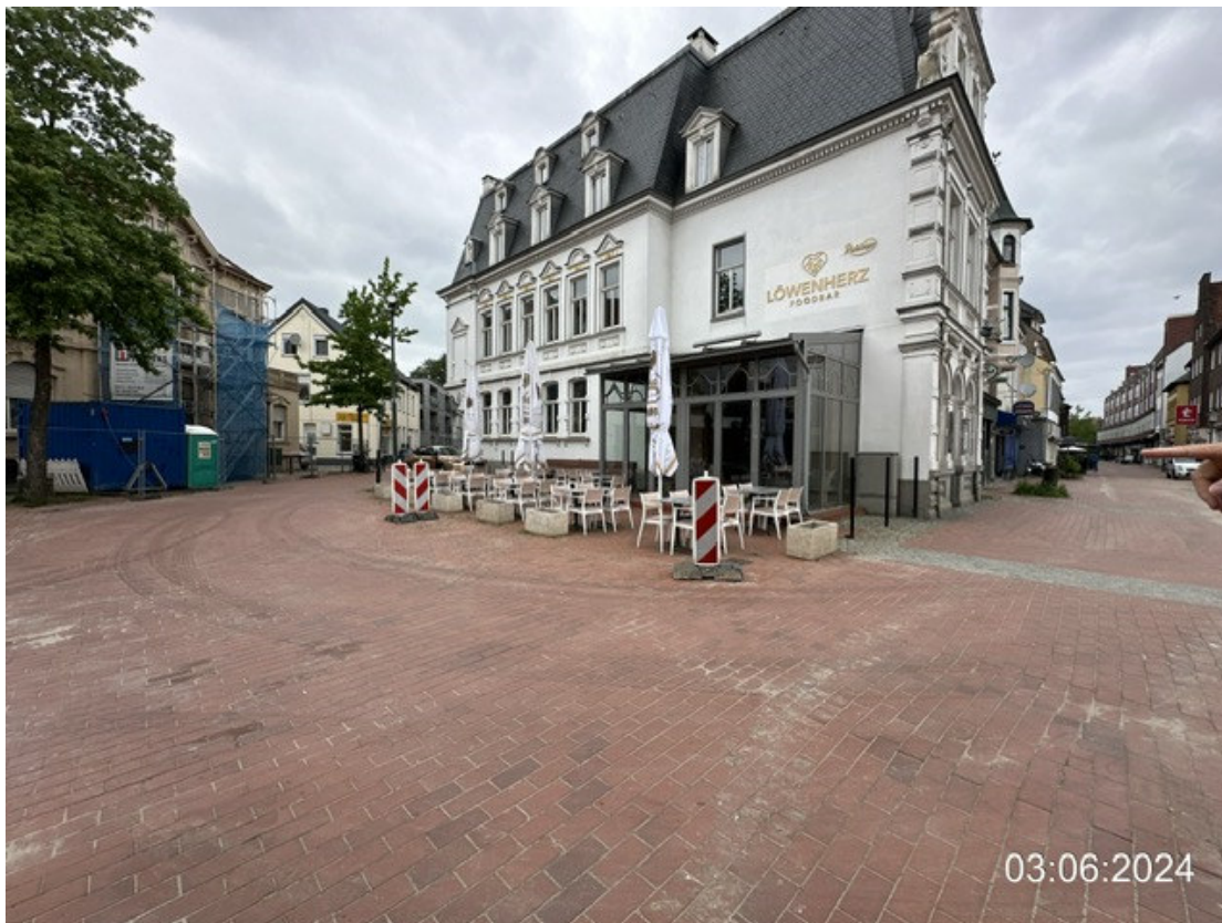
Bahnhofstraße, Außengastronomie Löwenherz, neue Markise mit Stützpfeilern geplant