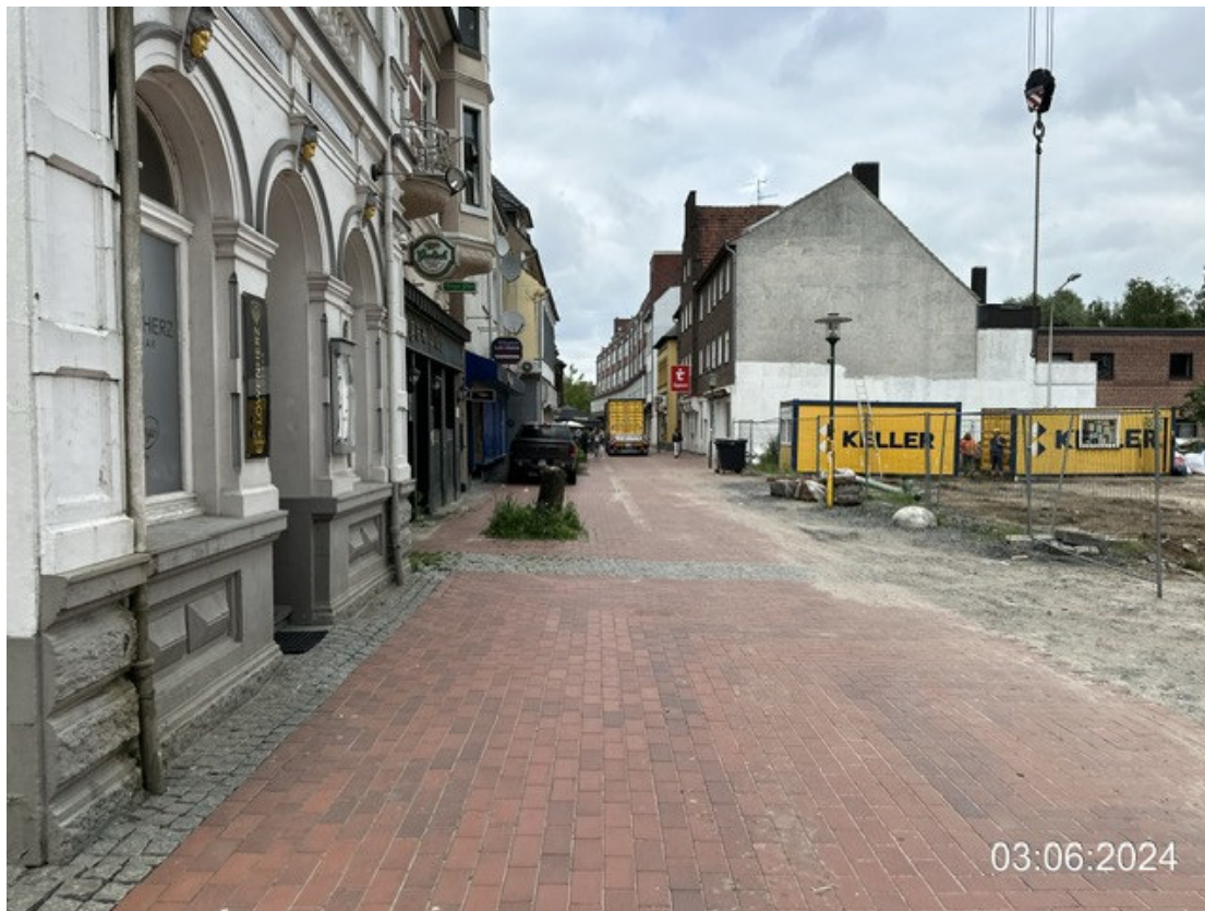
Bahnhofstraße, Blickrichtung Zollstraße