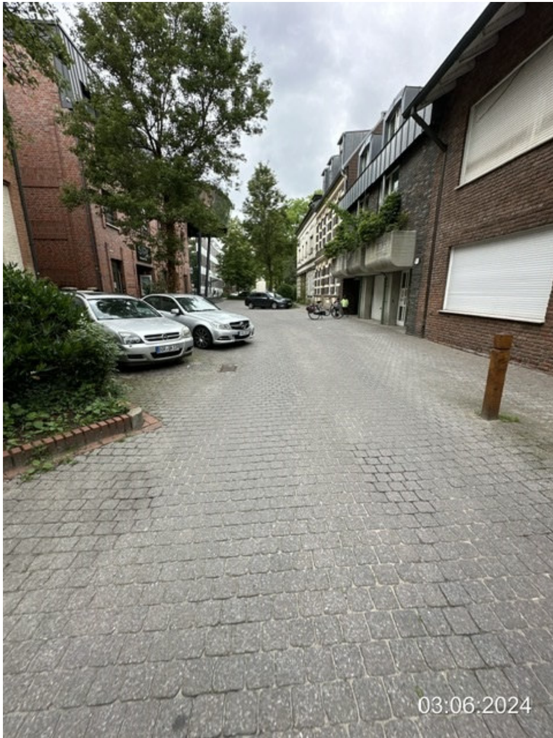
Mühlenmathe Blickrichtung Zollstraße, enge Straßensituation