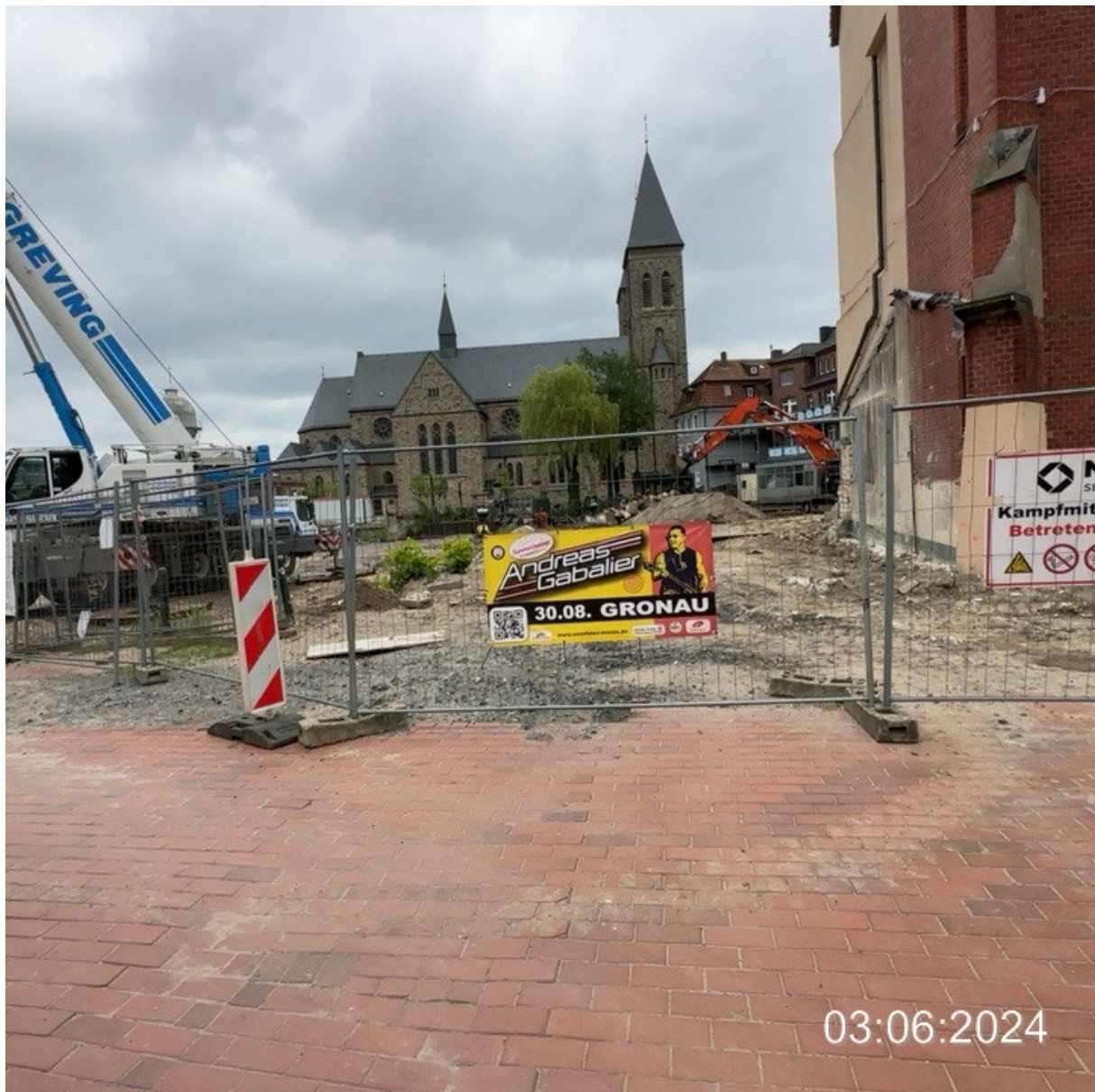
Bahnhofstraße, Baustelle, Blickrichtung Kirche