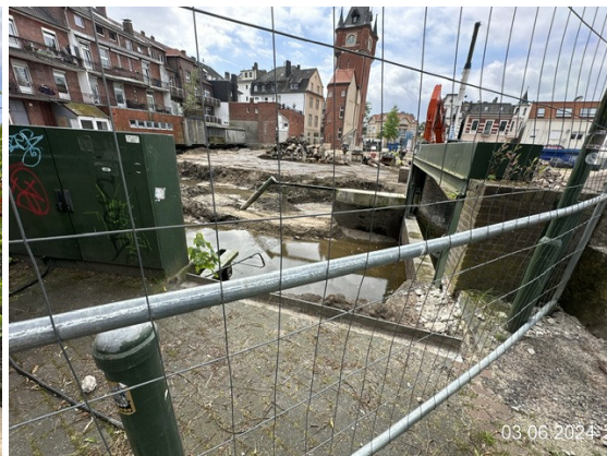
Baustelle aus Blickrichtung Rathausurm, im Vordergrund Dinkel mit niedriger Wasserführung