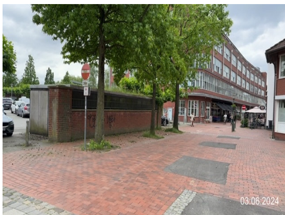
Bahnhofstraße, Blickrichtung Baustelle