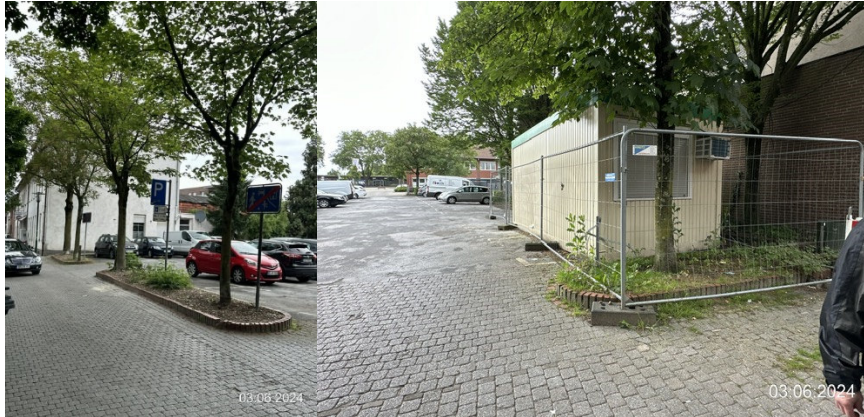
Parkplatz zwischen Zoll- und Poststraße, evtl. Absperrung von 5-10 Parkplätzen für die Baustelle