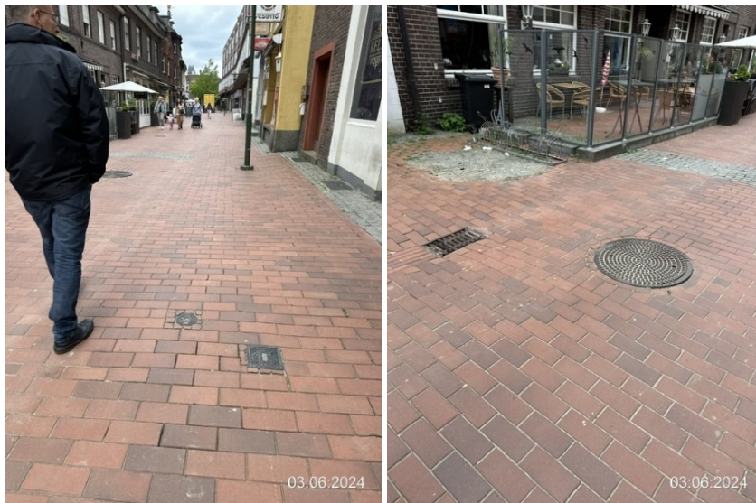
Bahnhofstraße, Blickrichtung Zollstraße