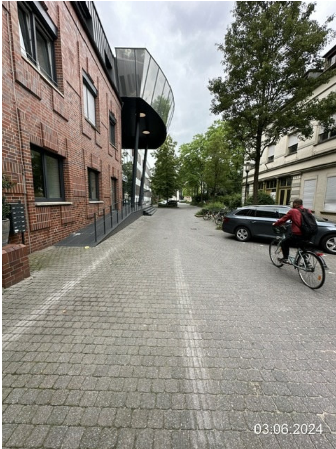
Mühlenmathe Blickrichtung Zollstraße, enge Straßensituation, evtl. Parkplatzbegrenzungen einplanen