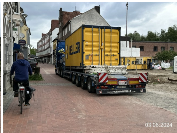
Bahnhofstraße, Baustelle, Sattelzug rückwärts eingefahren