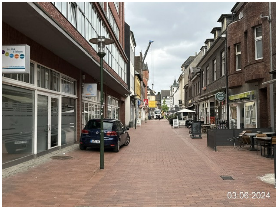
Bahnhofstraße Blickrichtung Baustelle, enge Straßensituation